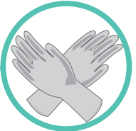
Guantes de látex