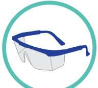
Lentes de seguridad

Para la atención médica pre hospitalaria es indispensable contar con equipo de protección :